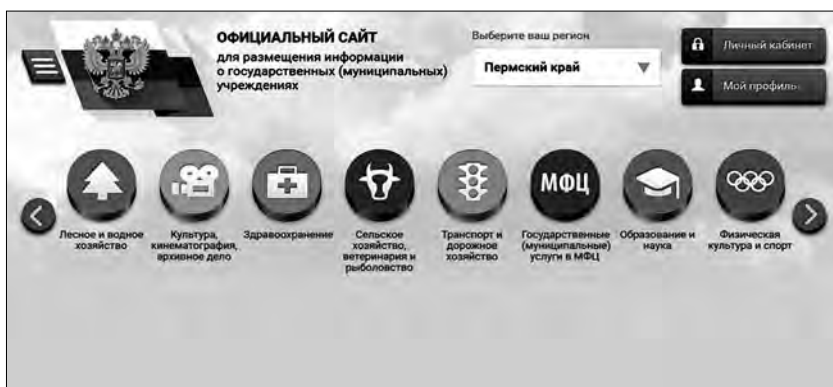
Рис. 2. Размещение базового (отраслевого) перечня государственных (муниципальных) услуг и работ в сфере Физической культуры и спорта на www.bus.gov.ru (необходимо выбрать раздел физическая культура и спорт)

Размещение базового (отраслевого) перечня государственных (муниципальных) услуг и работ в сфере Физической культуры и спорта на www.bus.gov.ru представлено на рисунке 2.