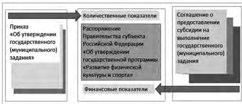
Рис. 5. Уточнение государственной программы «Развитие физической культуры и спорта»

Министерство спорта Российской Федерации рекомендует органу исполнительной власти субъекта Российской Федерации в области физической культуры и спорта (органу местного самоуправления) при планировании расходов на 2016 год включать затраты на финансирование государственных (муниципальных) учреждений физической культуры и спорта в государственную программу «Развитие физической культуры и спорта».