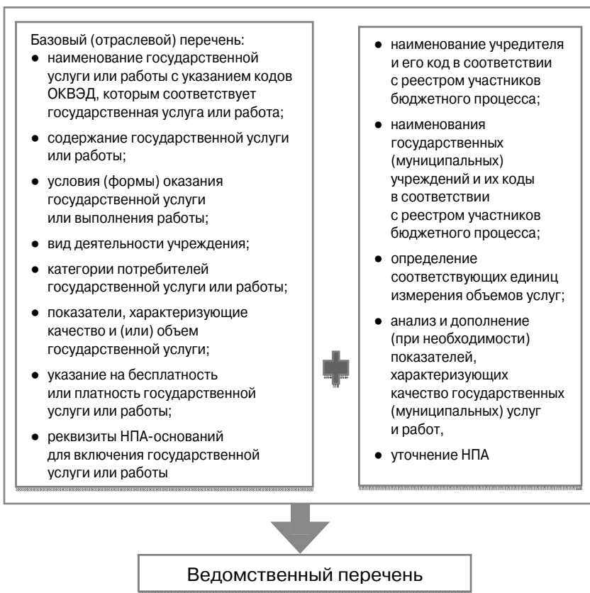
Рис. 1. Формирование реестровой записи ведомственного перечня государственных (муниципальных) услуг и работ

Для ведения ведомственных перечней государственных (муниципальных) услуг и работ и формирования предложений о внесении изменений в базовые (отраслевые) перечни государственных (муниципальных) услуг и работ органы государственной власти субъекта Российской Федерации, органы местного самоуправления, осуществляющие функции и полномочия учредителей бюджетных или автономных учреждений подключаются к компонентам системы «Электронный бюджет».