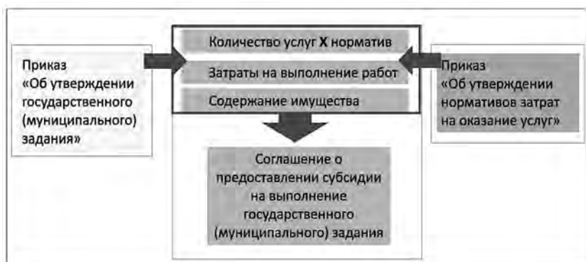
Рис. 4. Расчет субсидии на выполнение государственного (муниципального) задания

Министерство спорта Российской Федерации рекомендует не включать в состав базовых нормативов затраты на оказание государственной (муниципальной) услуги затраты на налоги (земельный налог и налог на имущество). На текущий момент уже известна практика, подтверждающая ошибочность такого шага и приводящая к возможности закрытия учреждения. Налоговые платежи рекомендуется включать в состав затрат на содержание имущества.