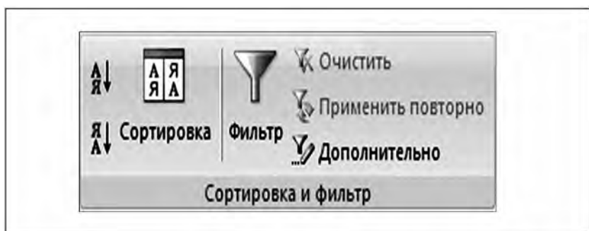
Рис. 4. Средства фильтрации MS Excel

Обращаем ваше внимание на то, что государственное (муниципальное) задание подведомственным учреждениям может утверждаться только в отношении тех услуг и работ, которые включены в ведомственный перечень государственных (муниципальных) услуг и работ.