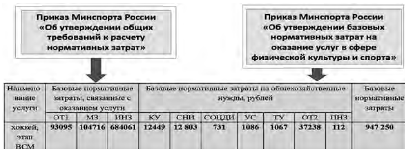
Рис. 2. Схема определения нормативных затрат на оказание государственных (муниципальных) услуг

Схема определения базовых нормативных затрат на оказание государственных (муниципальных) услуг в сфере физической культуры и спорта приведена на рис. 2).