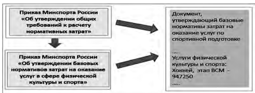
Рис. 3. Утверждение нормативных затрат на оказание государственных (муниципальных) услуг

управления) утверждает базовые нормативные затраты на оказание государственной (муниципальной) услуги (в том числе услуги в сфере физической культуры и спорта), оказываемой государственным (муниципальным) учреждением субъекта Российской Федерации (муниципального образования), на очередной финансовый год, а также корректирующие коэффициенты к базовым нормативным затратам на оказание государственной (муниципальной) услуги, оказываемой государственным (муниципальным) учреждением субъекта Российской Федерации (муниципального образования). Схема утверждения нормативных затрат на оказание государственных (муниципальных) услуг приведена на рисунке 3.