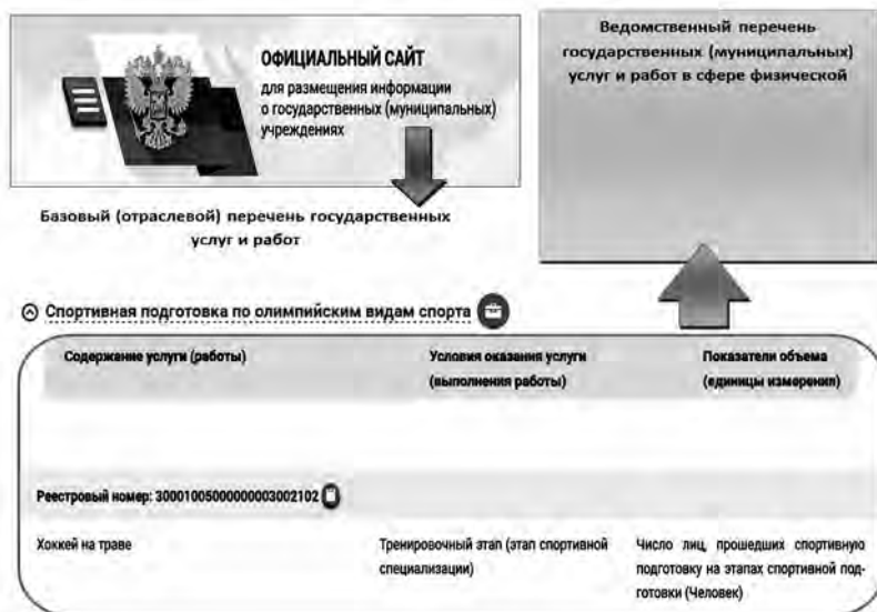
Рис. 1. Формирование ведомственного перечня государственных (муниципальных) услуг

Орган исполнительной власти субъекта Российской Федерации в сфере физической культуры и спорта (орган местного самоуправления) должен сформировать ведомственный перечень государственных (муниципальных) услуг и работ, оказываемых (выполняемых) государственными (муниципальными) учреждениями физической культуры и спорта субъекта Российской Федерации (муниципального образования), в соответствии с базовым (отраслевым) перечнем государственных (муниципальных) услуг и работ в сфере физической культуры и спорта, находящемся на официальном сайте для размещения информации о государственных (муниципальных) учреждениях ( http://bus.gov.ru/ ) (рис. 1).